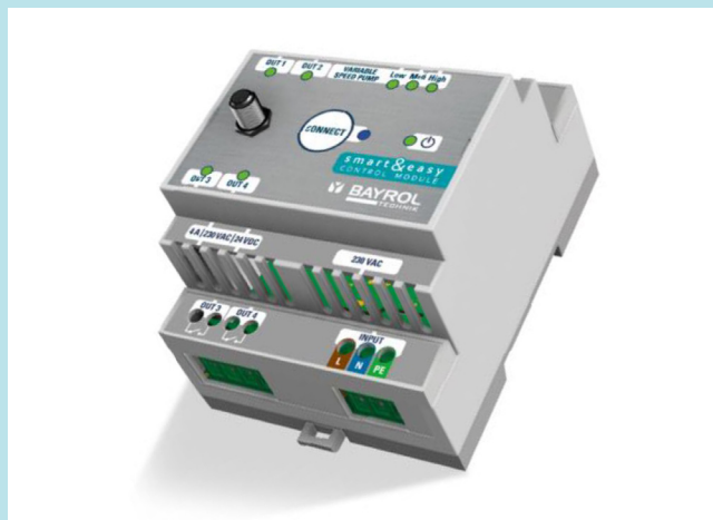
PRIX DE VENTE CONSEILLÉ : 590€ TTC POINTS DE VENTE : Piscinistes

Tous les équipements commandés sont directement branchés et contrôlés par les relais du Smart&Easy Control Module. Un contacteur de puissance peut être utilisé dans le cas d'utilisation avec des équipements dont la consommation électrique est élevée (par exemple une pompe de filtration standard).